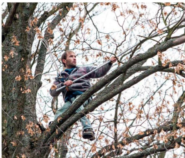
Získávání semen javoru klen