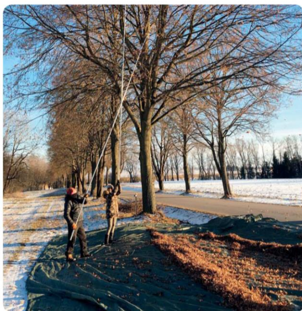
Setřásání nažek lípy srdčité do předem připravených plachet

Ze zpracovaného osiva se musí nakonec ještě odebrat vzorky semen a odeslat je do akreditované zkušební laboratoře