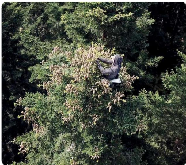
Sběr šišek jedle bělokoré