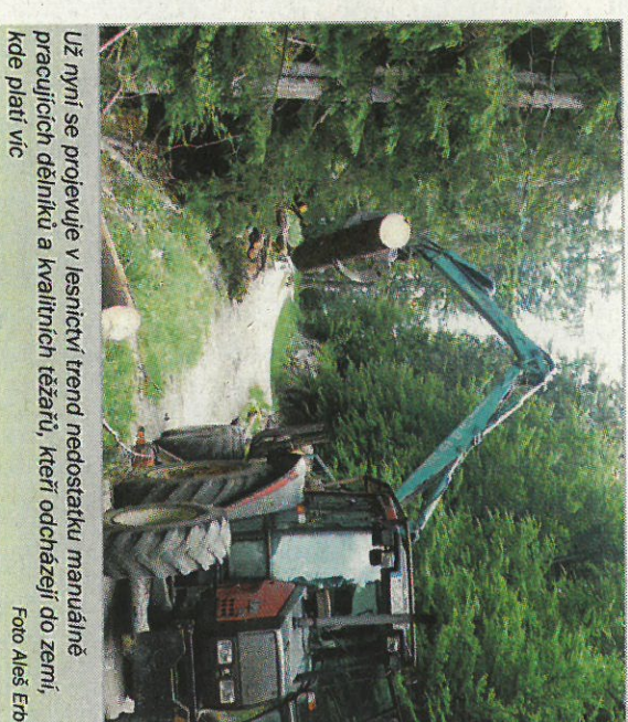
Už nyní se projevuje v lesnictví trend nedostatku manuálně pracujících dělníků a kvalitních těžářů, kteří odcházejí do zemí, kde platí víc

odměňování, jak je vidět z grafu 2, jsou zaměstnanci či najímání živnostníci placení v průměru ještě hůře. To zřejmě odpovídá faktu, že at vlastníci lesů se svými zaměstnanci, ti živnostníci jsou schopni minimalizovat své náklady a zefektivnit lesní práce. Proto jsou tito pracovníci poskytnuti akceptovat nižší odměňování své práce, protože v porovnání např. s lesními dělníky vykonávajícími práce pro smluvní partnery LČR mají v konečném součtu vyšší platy. Proto ti pracovníci, co v lesnictví zůstali pracovat, a to hlavně pro smluvní partnery LČR, lze nazvat doslova posledními mohykány, kterým nelze než poděkovat za jejich usilí. Bez nich by byla situace v lesích ještě